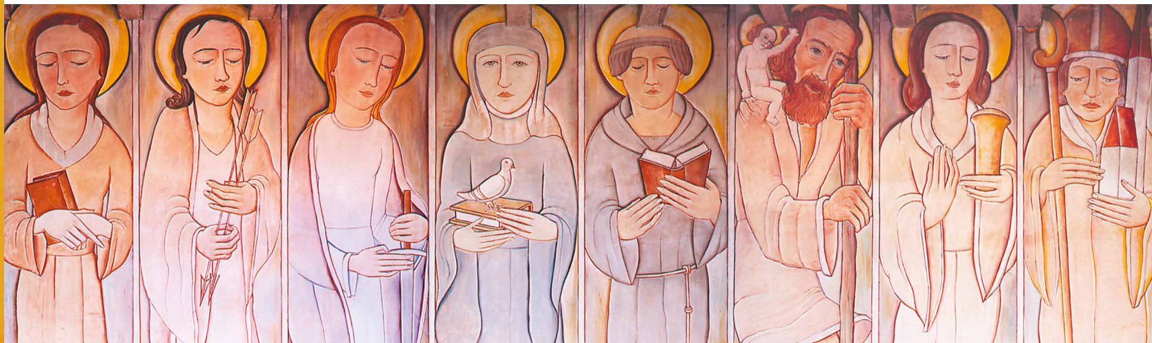
Wandbilder von G. Ph. Wörten

„Da uns eine solche Wolke von Zeugen umgibt,“ können wir es wagen, mit anderen Menschen zum Schmerzhaften ihres Lebens zu gehen.